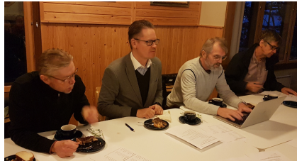
Kuvia syyskokouksesta 2018 Kallioniemessä

Kallioniemen ja laitureiden kunnostustalkoita oli keväällä ja syksyllä kahtena lauantaipäivänä.