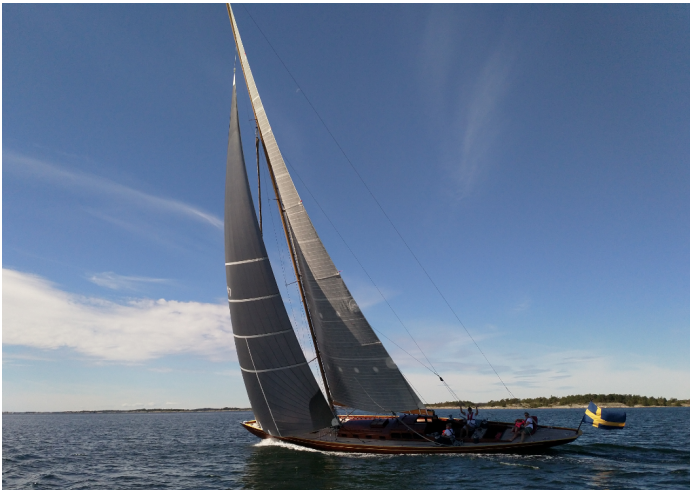
kuvia kesäpurjehduksilta 2018